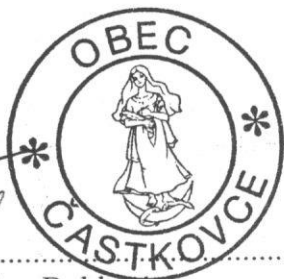
Mgr. Dušan Bublavy starosta obce Častkovce